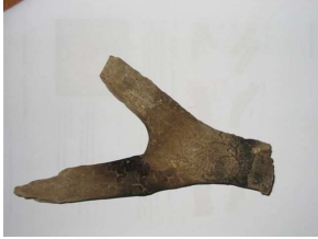
Blok 8 Waakvlamscherm