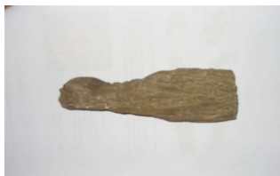
Blokken 4 & 5